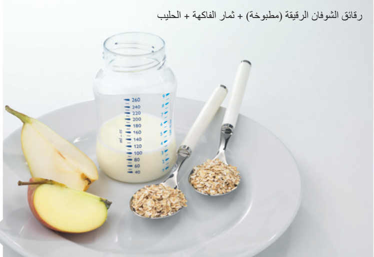
رقائق الشوفان الرقيقة (مطبوخة) + ثمار الفاكهة + الحليب