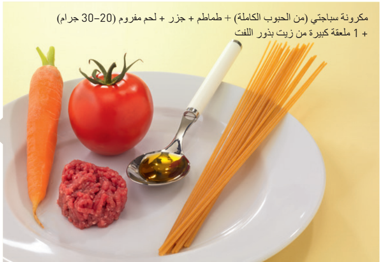
مكرونه سباجتي (من الحبوب الكاملة) + طماطم + جزر + لحم مفروم (20-30 جرام) + 1 ملعقة كبيرة من زيت بذور اللفت