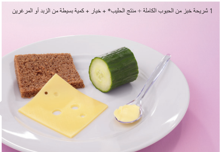
1 شريحة خبز من الحبوب الكاملة + منتج الحليب* + خيار + كمية بسيطة من الزبد أو المرجرين