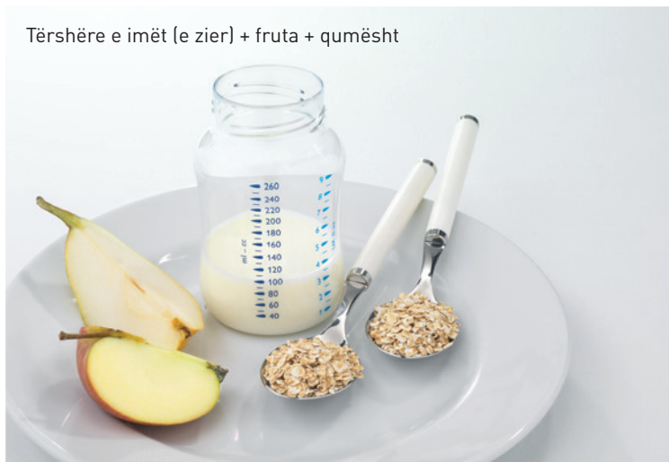
Tërshëre e imët (e zier) + fruta + qumësht

Rreth fundit të vitit të parë të jetës bëhet kalimi nga ushqimi për bebe tek ushqimi për të rritur.