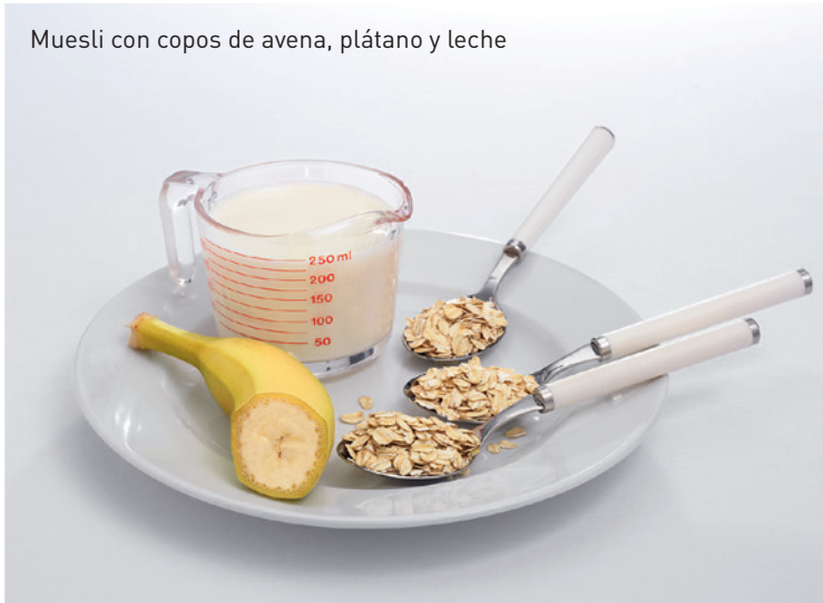
Muesli con copos de avena, plátano y leche