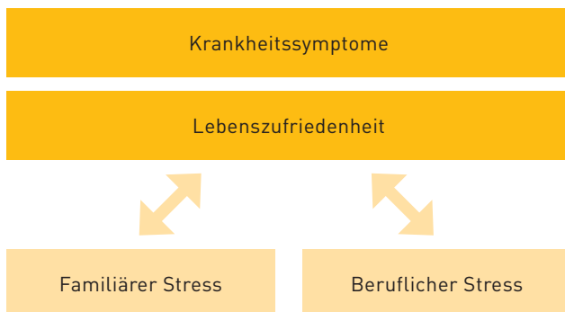
Abbildung 1: Fragestellung als Schema

Die Fragestellungen und die Zusammenhänge, die im Bericht untersucht werden sollten, sind in Abbildung 1 ersichtlich.